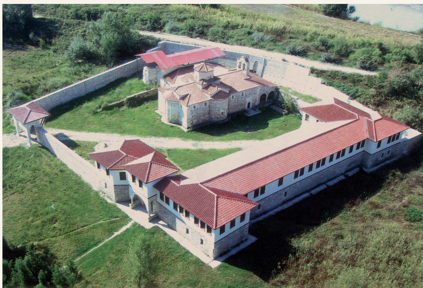
Πανοραμικὴ ἄποψη τῆς ἀνακαινισμένης Ἱ.Μ. τοῦ Ἁγ. Κοσμᾶ τοῦ Αἰτωλοῦ στὸ Κολικόντασι τῆς Ἀλβανίας.