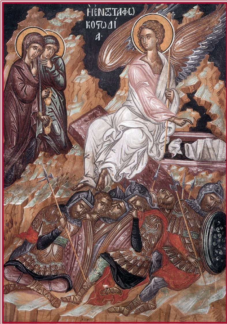
Ἡ ἐν τῷ τάφῳ κουστῶδια (Τοιχογραφία Ἱ.Μ. Φιλανθρωπινῶν, Ἰωάννινα).