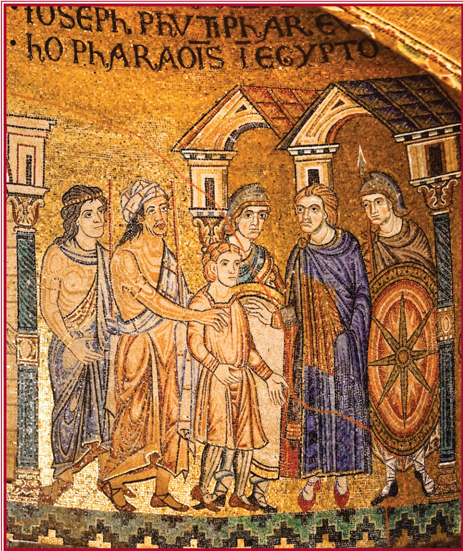
Ὁ Ἰωσήφ μπροστά στον Φαραώ. (Ψηφιδωτό τῆς Βασιλικῆς τοῦ Ἁγίου Μάρκου, Βενετία).