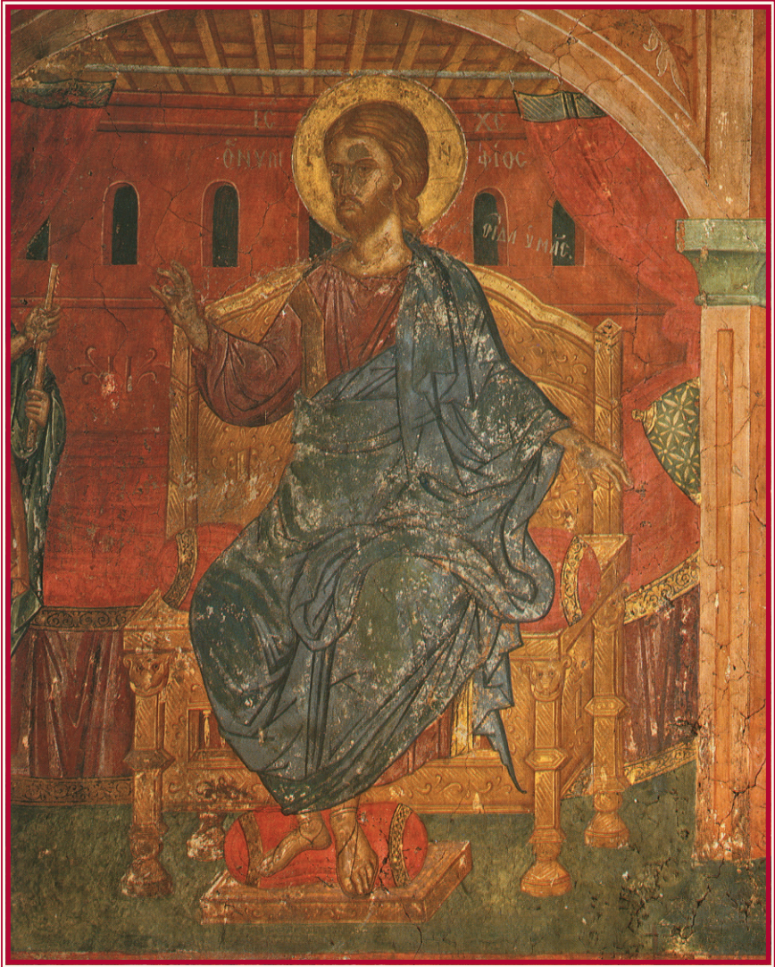
Ὁ Χριστός Νυμφίος 16ος αἰ. (Τοιχογραφία στὸν Ἐσωνάρθηκα τοῦ Καθολικοῦ τῆς Μονῆς Πάτμου).