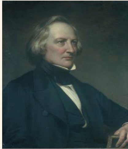
Georg Ludwig von Maurer

Πρώτιστο μέλημα τῆς Ἀντιβασιλείας ὑπῆρξε ἡ ἐξασφάλιση τῆς τάξης σὲ ὅλο τὸ κράτος καὶ γιὰ τὸν λόγο αὐτὸ κηρύσσει γενική ἀμνηστία μόνο γιὰ τὰ πολιτικὰ ἀδικήματα, ἀπαγορεύει τὴν ὀπλοφορία καὶ ἐπιβάλλει ἀυστηρότατες ποινὲς γιὰ κακουργήματα καὶ πλημμελήματα πὺ ἀφοροῦν τὴ δημόσια ἀσφάλεια, γιὰ ληστεῖες καὶ πειρατεῖες κ.ἄ. Ἐπίσης, καταργεῖ τὰ τακτικά καὶ ἄτακτα στρατεύματα καὶ ἀνέλαβε τὴν ὀργάνωση τοῦ νέου στρατοῦ 6 .