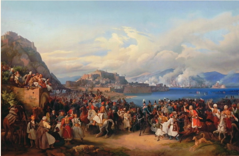
Ἡ ἄφιξη τοῦ Ὄθωνα στὸ Ναύπλιο