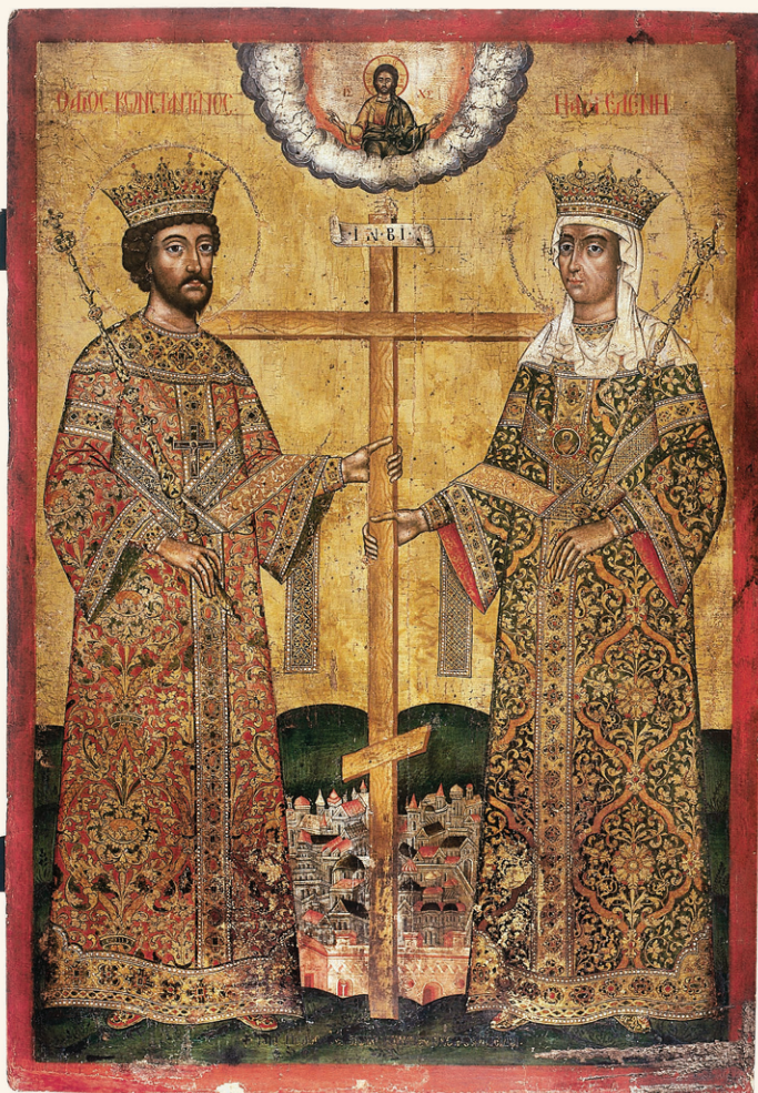
Άγιοι Κωνσταντίνος και Έλένη, 17 ος αί.

Φυλάσσεται στο Έθνικό Μουσείο Τέχνης τής Ρουμανίας