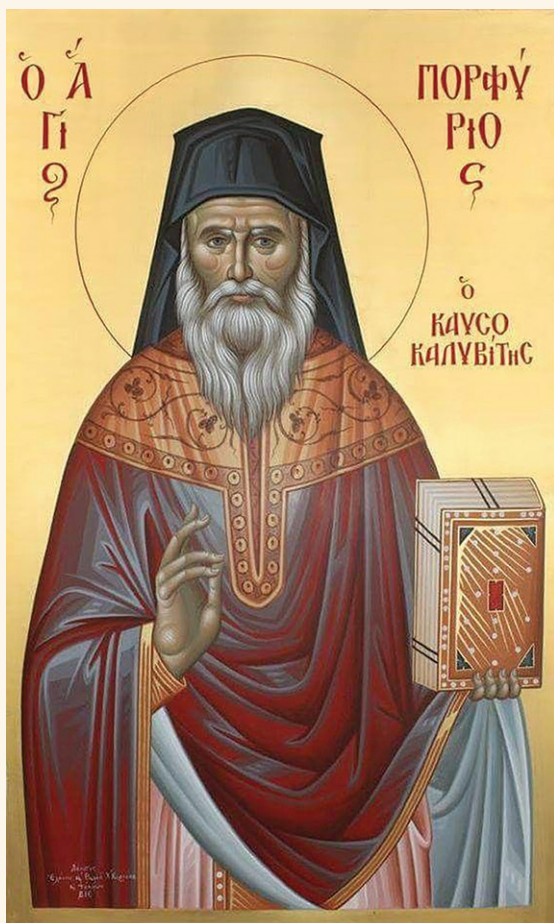
Ἅγιος Πορφύριος ὁ Καυσοκαλυβίτης

τὸν στείλει ὁ Χριστός, ὅπου θέλει ἡ ἀγάπη του. Προτοῦ φύγει γιὰ τοὺς οὐρανοὺς δὲν φοβότανε τὴ δευτέρα Παρουσία, οὔτε ἤθελε νὰ σκέφτεται πλέον τὶς ἀμαρτίες του, ἀλλὰ μόνο τὴν