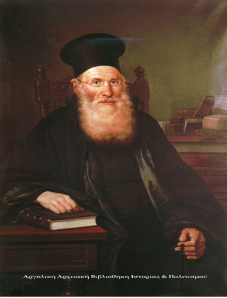
Θεόκλητος Φαρμακίδης (1784-1860)

(Πηγή: https:// argolikivivliothiki. gr/2011/02/03/theoklitos- pharmakidis-