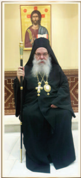
Ἡ Α.Π. ὁ Μητροπολίτης Τριφυθοῦντος καὶ Πρόεδρος Λευκάρων κ. Βαρνάβας Ὀνομαστικὴ ἑορτὴ: 11 Ἰουνίου