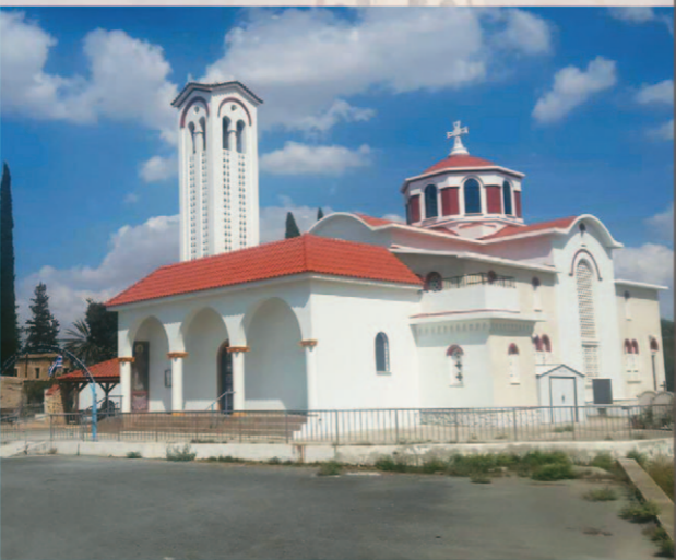
Ἐρὸς Ναὸς Ἁγίας Παρασκευῆς, Νήσου