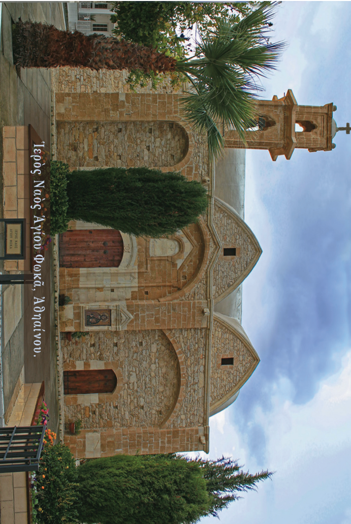
Γερός Ναός Αγίου Φωκά, Αθηαίνου.